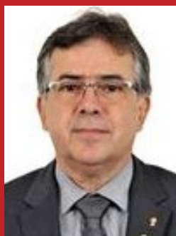
JOAQUIM PASSARINHO (PSD)